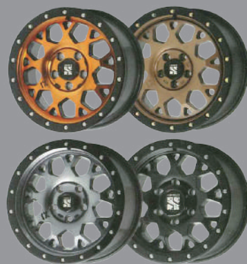
エクストリームJ XJ04 各種