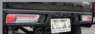
※色は各スタイルで異なります。