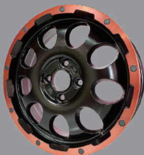
レアマイスター CS-9 4.5J-15 各種 1本 WL000940