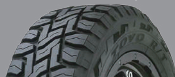
TOYO オープンカントリー R/T