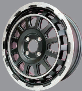
バーンズテック DHストリーム 5.0J-15 各種 1本 WB000945